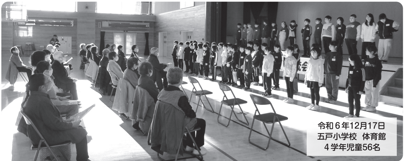
令和6年12月17日 五戸小学校 体育館 4学年児童56名